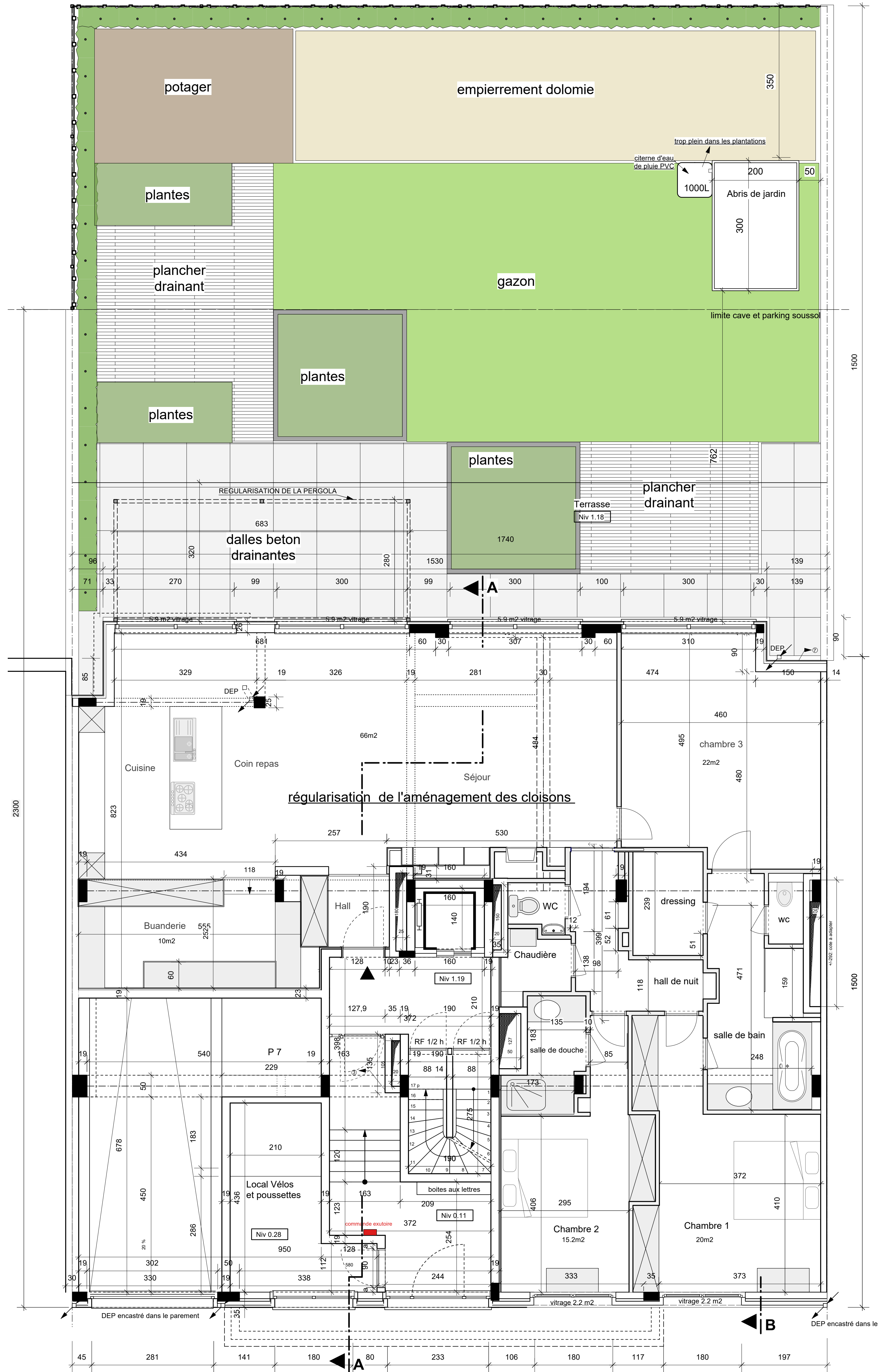
SITUATION EXISTANTE PLAN REZ DE CHAUSSEE